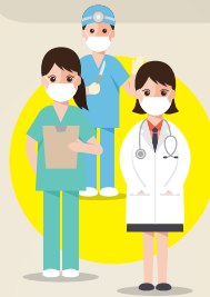
PANDEMIAS, COMO LA QUE CONOCEMOS AHORA