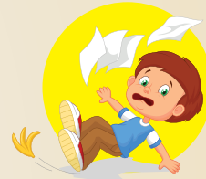
CAÍDAS EN EL PARQUE, EN NUESTRA CASA O EN LA ESCUELA.