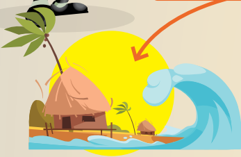
FENÓMENOS NATURALES: HURACANES, TERREMOTOS.