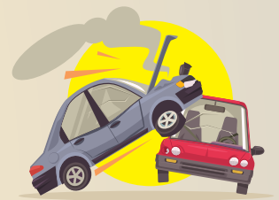
ACCIDENTE DE AUTO

Cada una de estas situaciones, dependiendo de su gravedad, pueden poner en peligro la economía de nuestra familia.